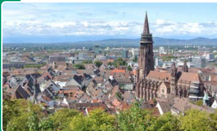
Blick vom Schlossberg auf die Freiburger Altstadt und das Münster

Freiburg, die sonnigste Großstadt Deutschlands, ist zudem für ihre hohe Lebensqualität über alle Grenzen hinweg beliebt und zieht unzählige Besucher an – und der Papst war auch schon da. Im Schatten des Freiburger Münsters laden malerische, von kleinen Bächen durchzogene Altstadtgassen und belebte Einkaufsstraßen zum Flanieren ein. Viel Kultur und Geschichte, quirlige Cafés und populäre Open-Air-Veranstaltungen prägen das Lebensgefühl in der dynamischen Stadt mit internationalem Flair und außerordentlich junger Bevölkerung. Die Universität Freiburg versteht sich in diesem Umfeld als Ideengeber: Sie macht ihre Forschungsergebnisse öffentlich zugänglich und nutzt vielfältige Formate des Wissenstransfers, um mit den Menschen aus der Stadt und der Region in den Dialog zu treten, wissenschaftliche Erkenntnisse zu vermitteln und Impulse aus der Gesellschaft aufzunehmen.