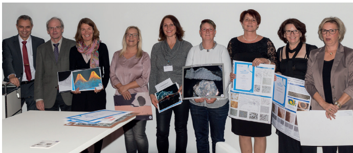
Preisträgerinnen des Fotowettbewerbs Metallographie-Tagung 2017